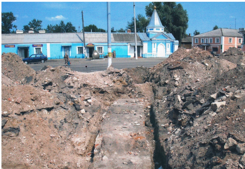
20. Обезглавленный Казанский собор уже без колокольни